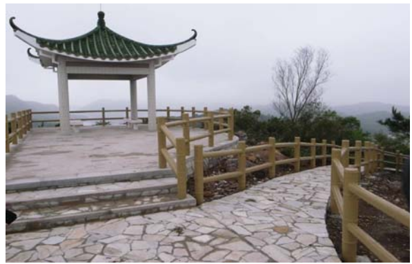
北区沙头角吉澳三圣宫至高地顶由天然石铺砌的步行径