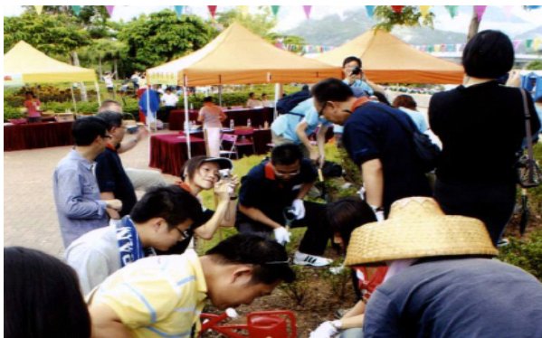
离岛区议会、离岛民政事务处和康乐及文化事务署合办的植树日

8. 除了在地区环境改善工程计划采取环保措施之外，我们继续鼓励社会各阶层在地区层面进行绿化工作，并为此举办多项社区参与活动，让市民共同参与，例如植树日、园艺工作坊、绿化嘉年华、生态旅游、展览、工作坊、比赛，以及废物源头分类计划等。