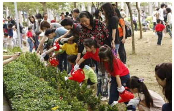
东区区议会和东区民政事务处合办的绿化日 2009