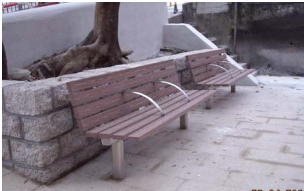
中西区山道 54-56 号休憩处的再造塑料板长椅

7. 本署在各地区推行小型环境改善工程，以改善区内的基础设施及提升居住环境质量。为支持环保，我们在所有工程合约加入环境污染管制条款。此外，我们采用环保物料进行小型工程项目，例如以天然石铺砌步行径、采用再造塑料板制造长椅，以及在社区中心推行更换光管计划，以能源效益较高的光管代替 T8 光管。