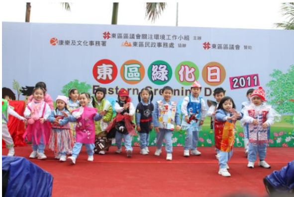
东区区议会和东区民政事务处合办的东区绿化日 2011

8. 除了在地区环境改善工程计划采取环保措施之外，我们继续鼓励社会各阶层在地区层面进行绿化工作，并为此举办多项小区参与活动，让市民共同参与，例如植树日、节能措施工作坊、绿化嘉年华、生态旅游、展览、比赛、废物源头分类计划等。