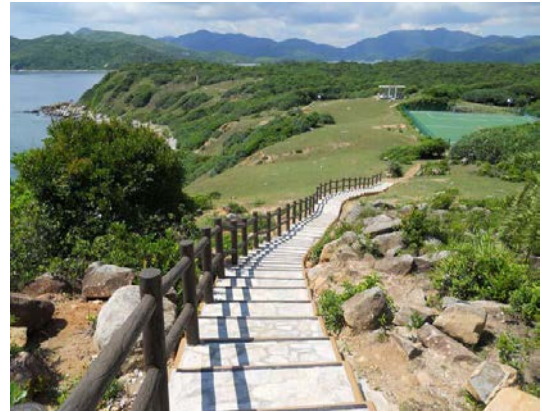
大埔西贡北塔门由天然石铺砌的郊游径