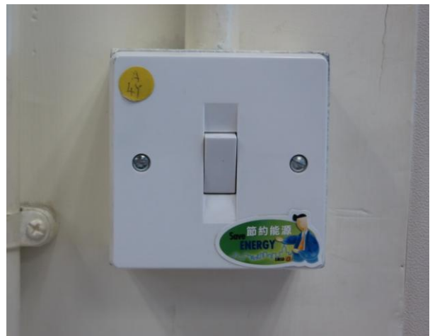
开关掣旁贴上“节约能源”标签