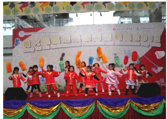
黄大仙区议会和黄大仙民政事务处 合办的“黄大仙区环保清洁活动日”