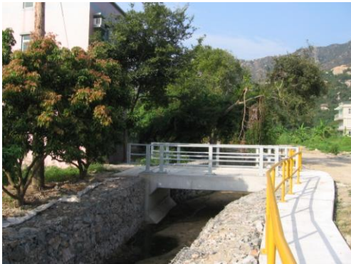
屯门龙鼓滩的溪涧 以天然石建造石笼护土墙作为河堤

7. 本署在各地区推行小型环境改善工程，以改善区内的基础设施及提升居住环境质素。为支持环保，我们在所有工程合约加入合适的环境污染管制条款。我们在设计工程项目时十分小心，着意减少可能对天然环境造成的影响，以及鼓励在小型工程项目采用环保物料，例如以天然石建造石笼护土墙作为河堤。我们并推行一项计划，利用太阳能推动水缸的水泵和照明系统。