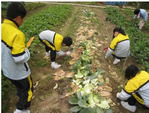
深水埗区议会举办的“绿色生活大使 培训计划(第二阶段)”

8. 除了在地区环境改善工程计划采取环保措施之外，我们继续在地区层面鼓励绿色生活。为此，举办多项小区参与活动，让社会大众参与，例如绿色生活分享会、绿色生活大使培训计划、绿色生活嘉年华、生态旅游、展览、比赛、厨余循环再造计划等。