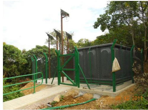
大埔西贡北洲尾 水缸的太阳能照明系统