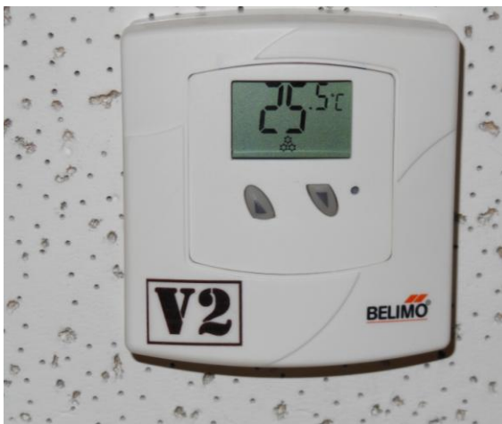
室内冷气温度保持在摄氏 25.5 度