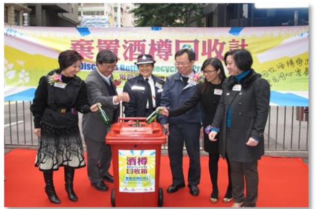
弃置酒樽回收计划