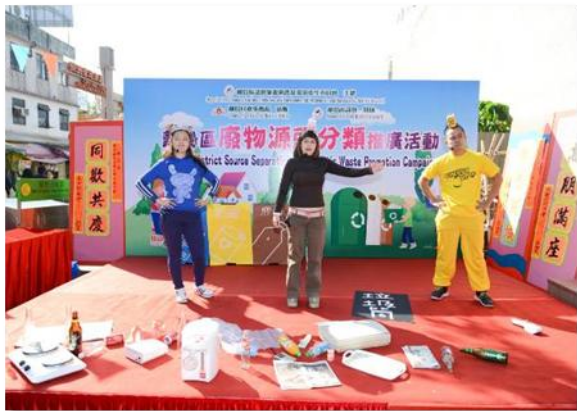
离岛区废物源头分类推广活动