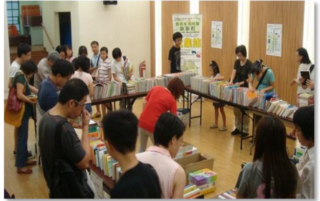
「旧书本旧校服新旅程」 书本／校服回收互换及转赠计划