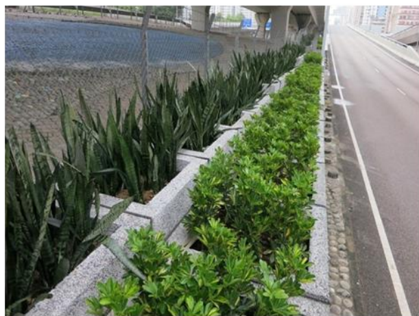
在行车天桥地带的绿化工程