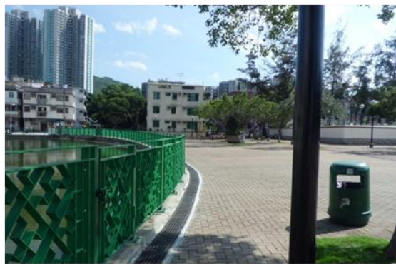
沿粉岭围村风水鱼塘建造的大型暗渠