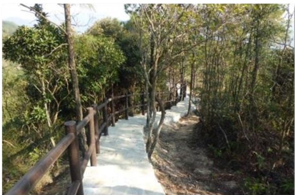
针山郊野径上以天然石建造的行人径

7. 本署在各地区推行小型环境改善工程，以改善区内的基础设施及提升居住环境质素。为支持环保，我们在所有工程合约加入合适的环境污染管制条款。我们在设计工程项目时着重确保工程减少对天然环境可能造成的不良影响，以及鼓励采用环保物料，例如以天然石建造行人径和作为河堤的石笼护土墙等。年内，我们沿粉岭围村的风水鱼塘建造了大型暗渠，让鱼塘排出的污水得以流入正式排水系统。