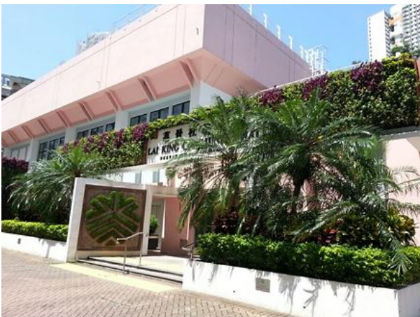
荔景社区会堂的垂直花园

11. 为了从源头减少绿化工程所产生的绿色废物，我们近年致力减少采用一年生植物，因这类植物需要经常更换并会制造大量园林废物。我们将改为选用耐种而美化效果相若的多年生植物，例如灌木，以取代原有栽种的一年生植物。