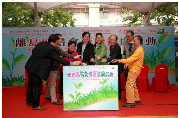
惜食减废推广活动