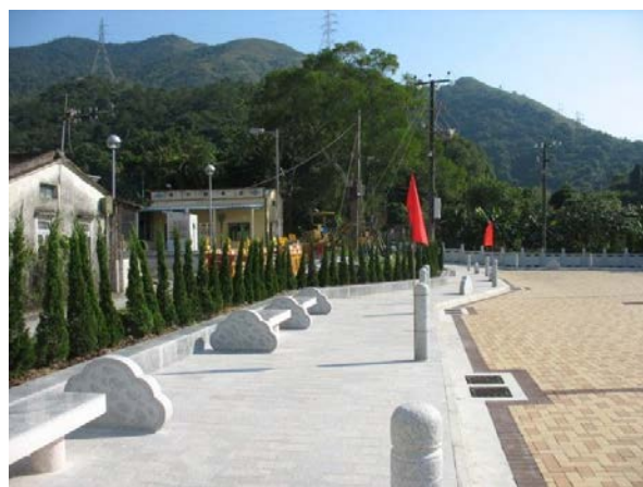
粉岭近松岭邓公祠乡村广场 行人路旁的花岗岩标记

7. 本署在各地区推行小型环境改善工程，以改善区内的基础设施及提升居住环境质素。为支持环保，我们在所有工程合约中均加入合适的环境污染管制条款。我们着重工程项目设计，以确保工程尽量减少对天然环境可能造成的不良影响，以及鼓励采用环保物料，例如以天然石建造行人径和作为河堤的石笼护土墙等。年内，我们亦在大埔头建造树木围栏，并在粉岭近松岭邓公祠乡村广场的行人路铺设花岗岩标记作分隔，以保护本土花卉和果树。