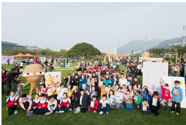
“咪做大嘍鬼”嘉年华暨颁奖典礼