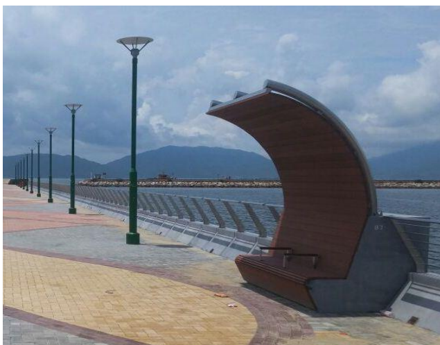
屯门第27区防波堤美化工程

8. 二零一四至一五年度采用环保物料的例子包括以天然石建造行人径和作为河堤的石笼护土墙等。年内，我们亦在屯门第27区进行防波堤美化工程，以及在打鼓岭坪洋村建造步行径并铺设地台。