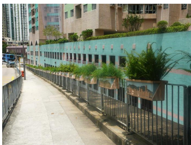
在路旁栽种多年生植物