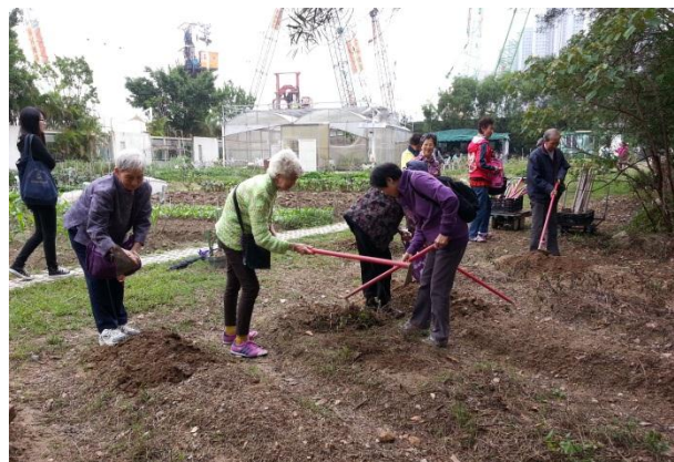
长者参观有机农场