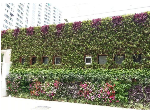
在荔景社区会堂种植绿化墙

11. 自二零一四年起，我们的绿化工作更多选用多年生植物，例如灌木，以代替一年生植物，因为多年生植物美化效果相若，但不需要经常更换，可避免制造大量园林废物。在二零一四至一五年度，我们在各区栽种了大约六万棵灌木，较二零一三至一四年度大幅增加 170%。