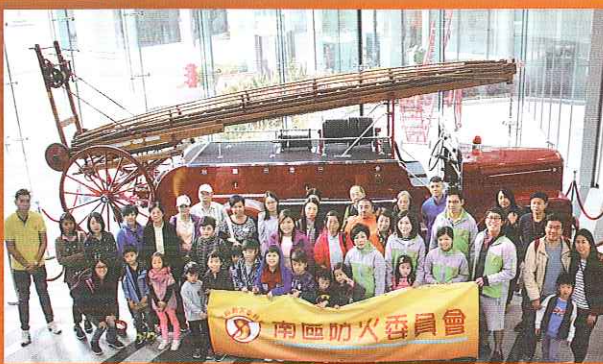
南區防火委員會委員與參加者合照留念