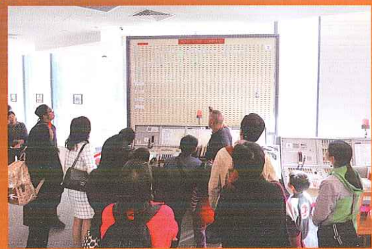
導賞員細心講解博物館內的各款展品