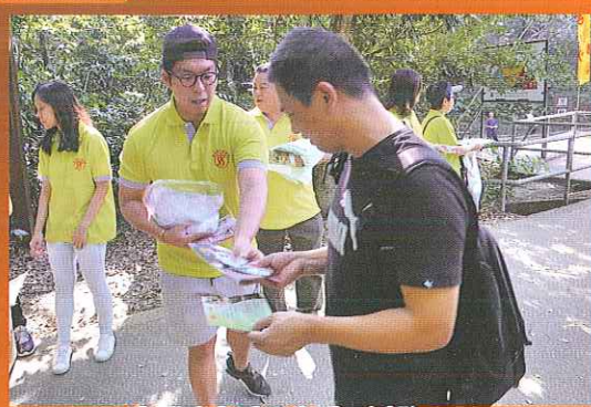
南區防火委員會委員派發防火宣傳紀念品予郊遊人士