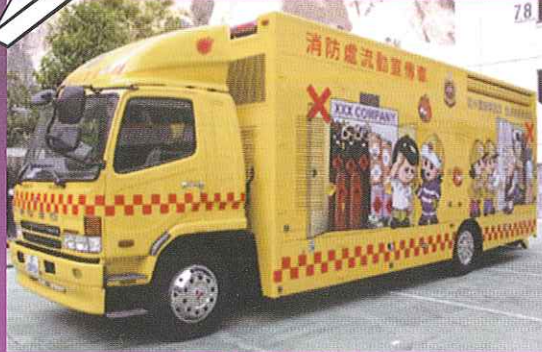
消防流動宣傳車 (Mobile Publicity Unit)

為了增進市民的消防安全知識和提高慎用救護服務的意識，消防處在大型防火運動、嘉年華會及消防局開放日均會向公眾展示下列車輛：