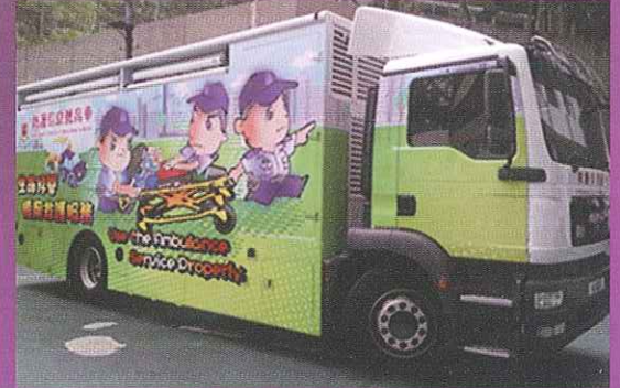
救護信息教育車 (Ambulance Service Education Vehicle)