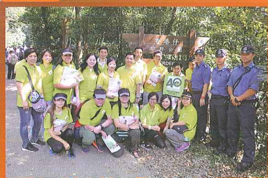
南區防火委員會委員、消防處代表及南區消防安全大使於郊野公園入口合照