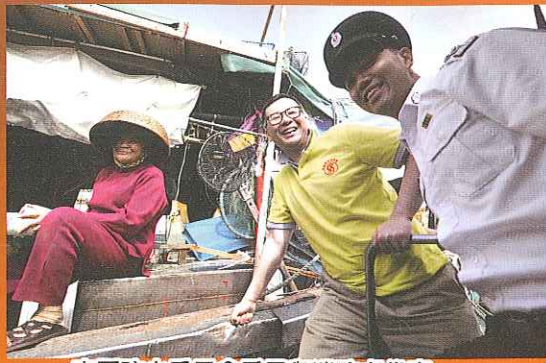
南區防火委員會委員與消防處代表 派發防火小冊子及紀念品予船家艇戶