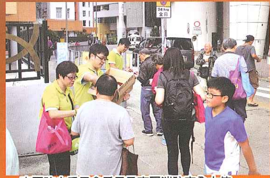
南區防火委員會委員及南區消防安全大使 向居民派發防火小冊子及紀念品