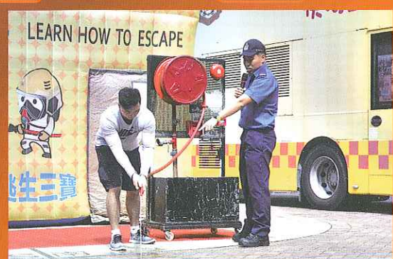
消防員即場示範消防喉轆的使用方法