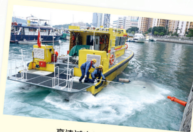
高速滅火輪救援示範