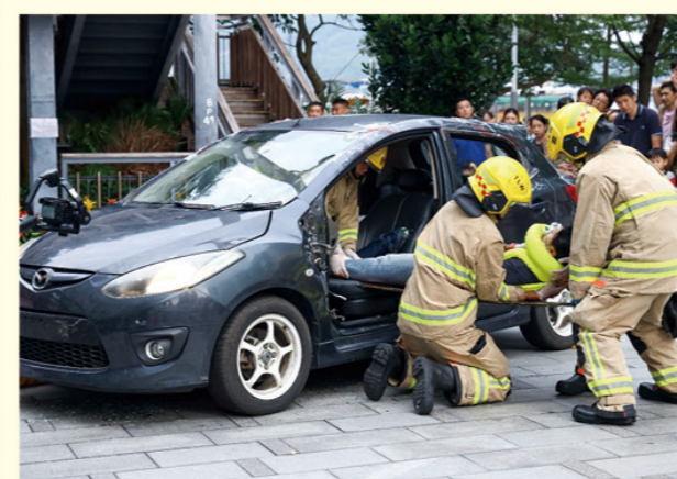
公路拯救刻不容緩