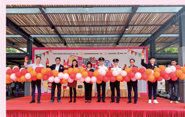
嘉賓主持開幕儀式